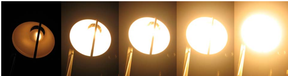
1/320 Sekunden 1/8 Sekunden 0,3 Sekunden 0,8 Sekunden 1,6 Sekunden Belichtungsreihe einer Schreibtischlampe mit davor hängendem Stift; ohne Weißabgleich.

Da bereits bei kleinen Digitalkameras Belichtungszeit und Blende manuell eingestellt werden können, sind hiermit lange und kurze Belichtungen möglich. (Es genügt im Schülerexperiment die Variation der Belichtungszeit, wobei sich die Verwendung eines Stativs oder einer stabilen Unterlage zur Auflage der Kamera empfiehlt.) Lange Belichtungszeiten können das Überstrahlen von Bildbereichen durch helle Flächen oder durch Lichtquellen verdeutlichen, so dass Details wie Fadenkreuze verloren gehen müssen.