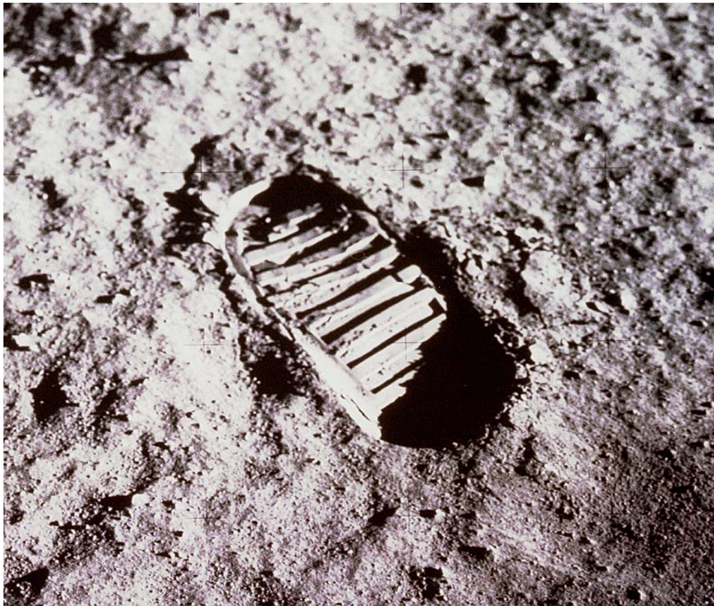
Fußspur auf dem Mond. < http://nssdc.gsfc.nasa.gov/planetary/lunar/images/as11_40_5878.jpg >