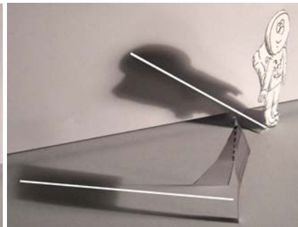
Mondboden geneigt. Schatten in verschiedenen „Richtungen“