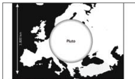
Größenvergleich des nur 2360 km großen Pluto mit dem europäischen Kontinent

Aus dem Leben eines frisch gebackenen Zwergplaneten